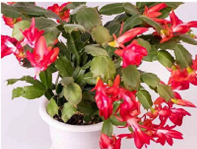
Подкормки для декабриста: для супер пышного цветения