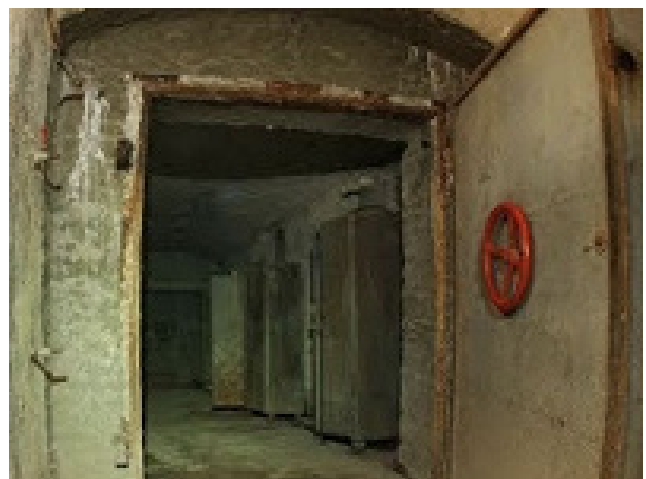
Мужик шел по лесу и наткнулся на объект-506