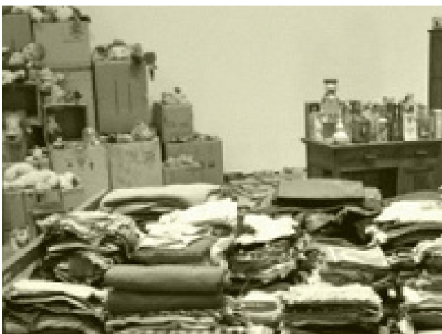
Что нужно сделать с вещами умерших: запомните раз и навсегда