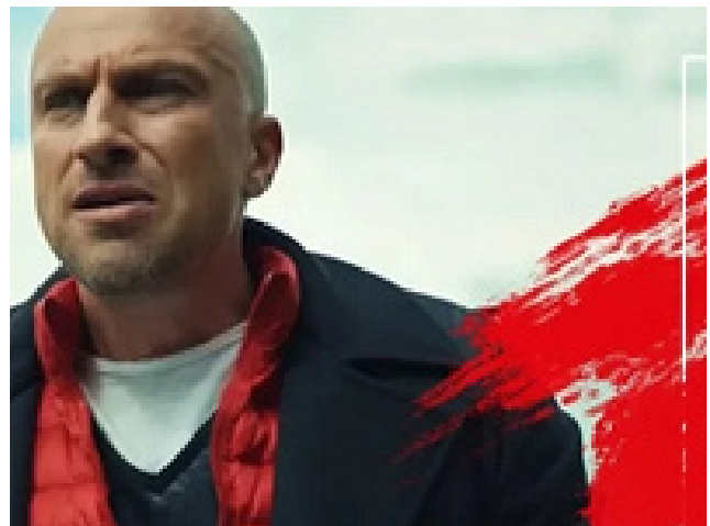
Сколько зарабатывает Дмитрий Нагиев на рекламе: будете удивлены