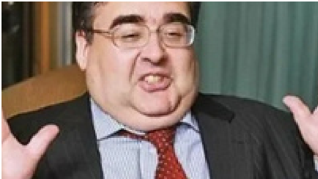
Что стало с известным политиком и шоуменом Алексеем Митрофановым